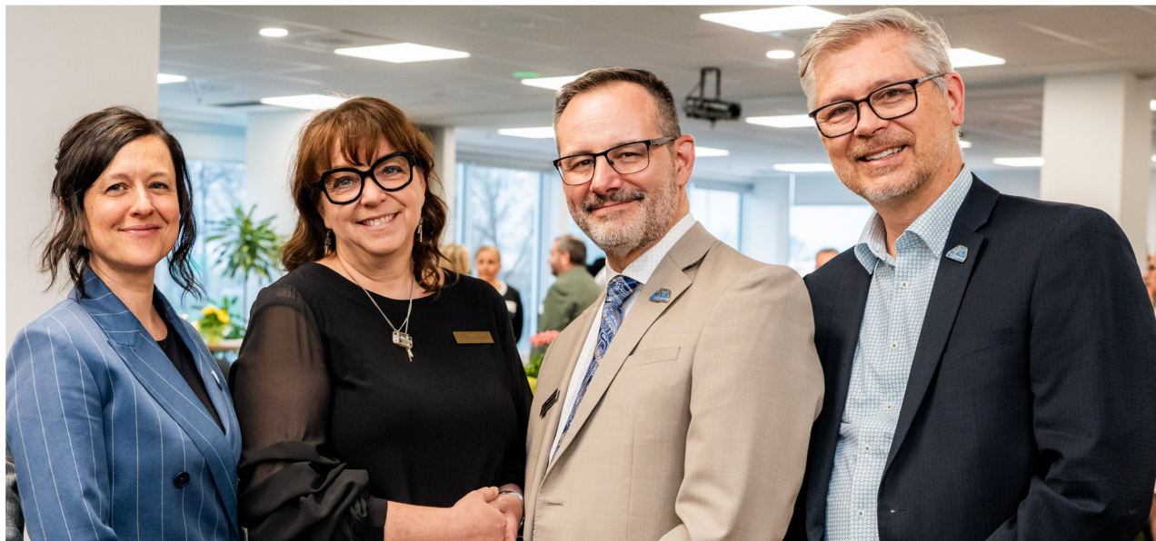
Photo : 5 à 7 du 40e anniversaire de l'APSAM.