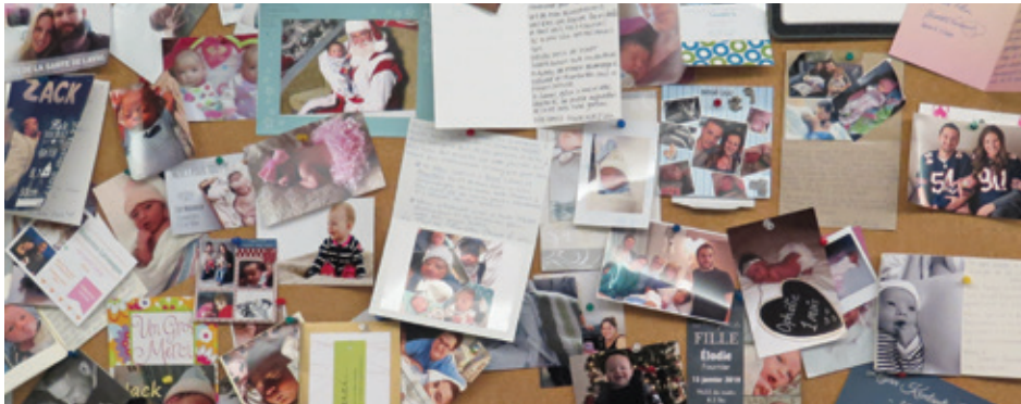
Le mur de reconnaissance au Module des naissances