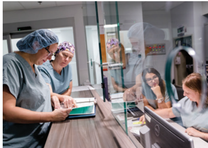
Équipe du bloc opératoire

Saviez-vous qu'au bloc opératoire de l'Hôpital, 6 salles de plus sont nécessaires ? Pour optimiser les soins et alléger les listes d'attente, de nouveaux équipements sont nécessaires afin de réaliser plus de 2000 mini-chirurgies par année. Grâce à la générosité de Monsieur Sauriol, ceux-ci seront désormais disponibles. MERCI !