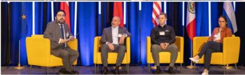
Le gala des MercadOr Laurentides s'inscrit dans une journée entièrement consacrée à l'exportation, animée avec le Sommet régional sur la diversification de marchés.