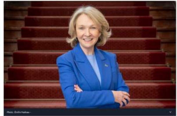
La ministre Bélanger explique le budget pour les Laurentides