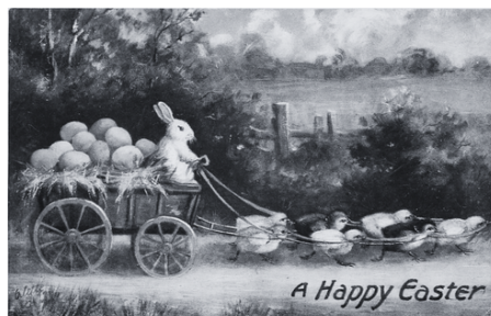
Carte de Pâques

En bref, la fête de Pâques a évolué, mais certains irremplaçables (comme le jambon à l'érable!) traversent le temps.