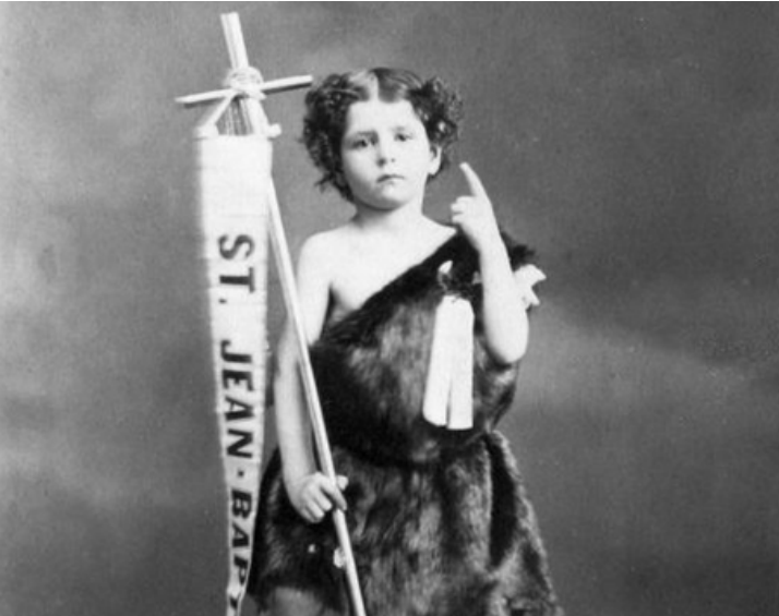
St Jean Batiste, Montréal, Qc, 1867 William Notman (domaine public), Wikimedia Commons

(Suite de la page 1) On allume des feux non pas pour célébrer le jour le plus court de l'année comme à Noël, mais bien pour marquer le début de la saison estivale. La tradition gagne la Nouvelle-France dès 1646. En 1694, Mgr de Saint-Vallier décide d'en faire une fête chômée vouée à la dévotion. Ce n'est qu'en 1834 que la Saint-Jean prend une couleur politique qu'elle conservera jusqu'à tout récemment.