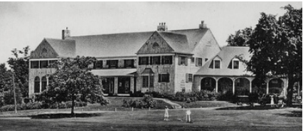
Club Hermitage, BanQ, domaine publique

Les promoteurs prévoient faire arriver tout ce beau monde à Magog par le train de Montréal puis par bateau public ou yacht privé jusqu'à l'Hermitage. Il faut donc s'attendre à voir débarquer prochainement dans notre gare une clientèle urbaine d'un genre plutôt huppé.