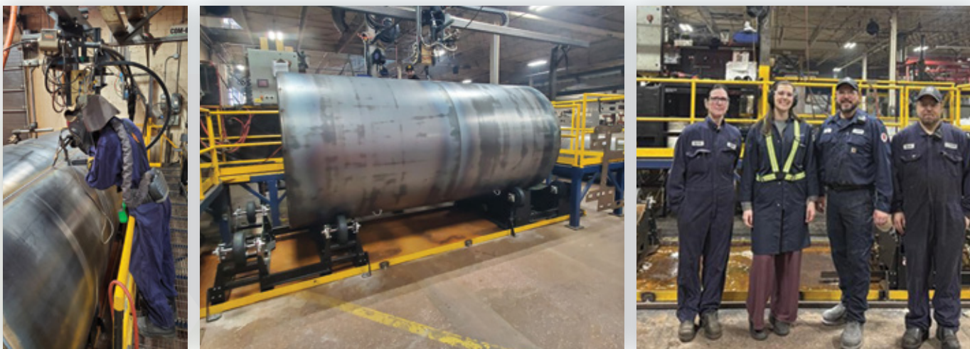
Parmi les membres de l'équipe ayant participé au projet.