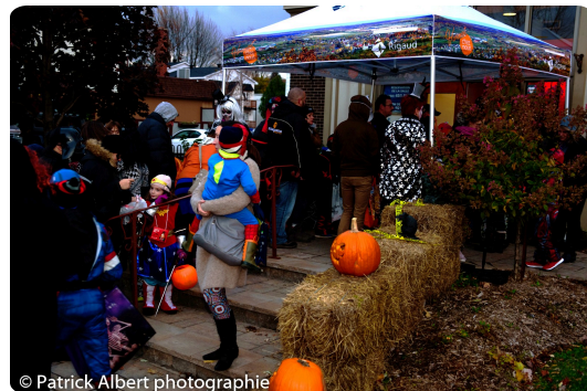
L'Halloween à Rigaud